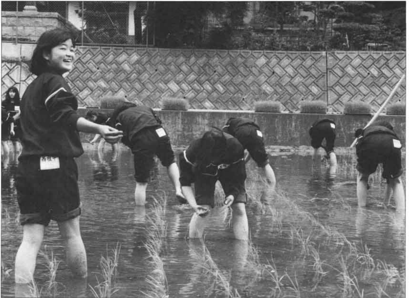
中学校『学校田』の田植