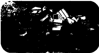
1月21日（日曜日）に収集しました粗大ゴミは4トン車に9台分になりました。