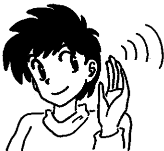
“耳を大切にしましょう”