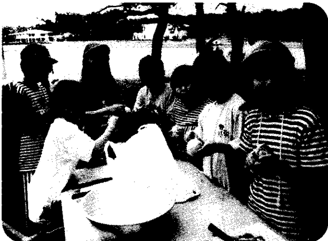
小学5年生 林間学校(本栖湖)