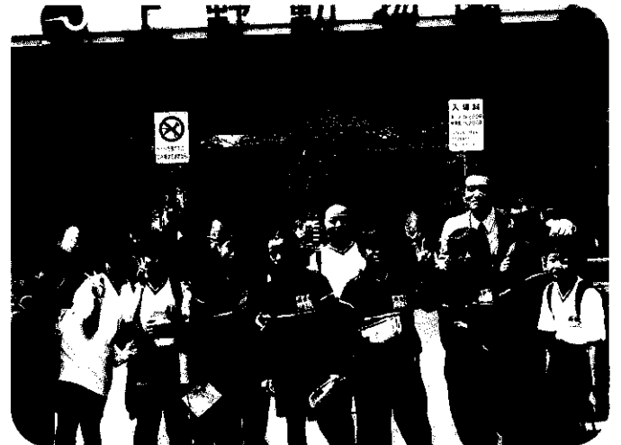
中学1年生 上野動物園