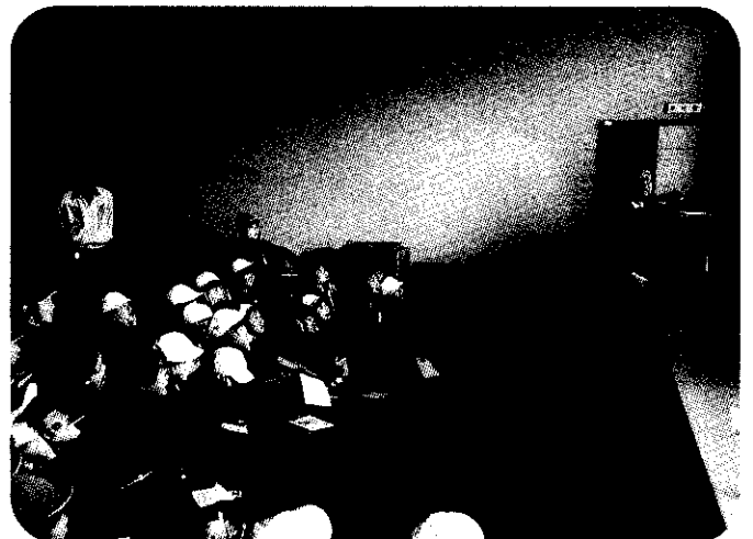
小学4年生 防災安全センター