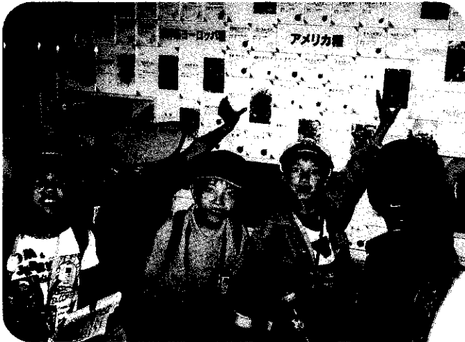
小学3年生 フルーツ公園