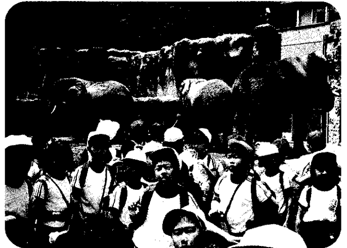
小学2年生 多摩動物公園