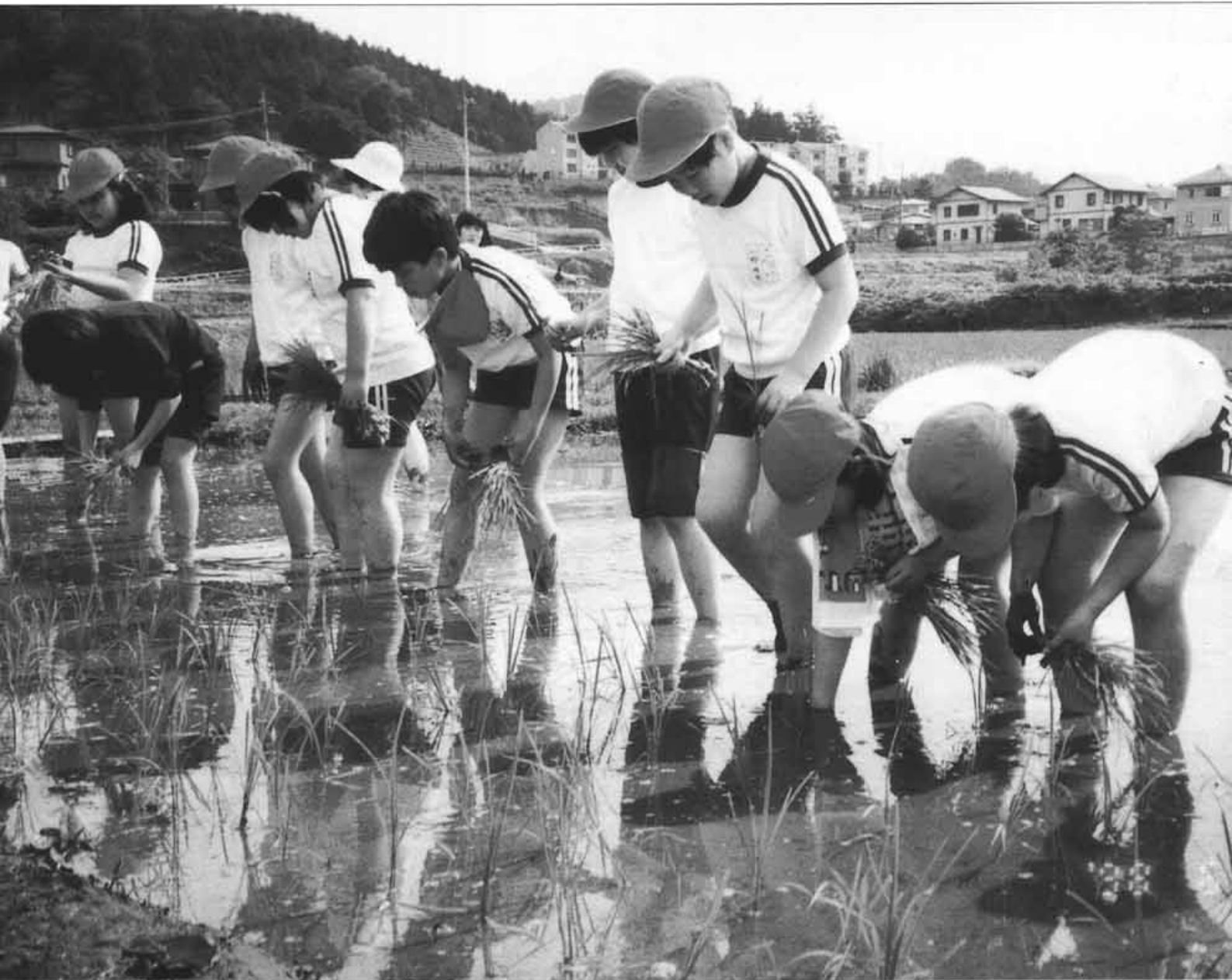
小学5年生 米づくり体験