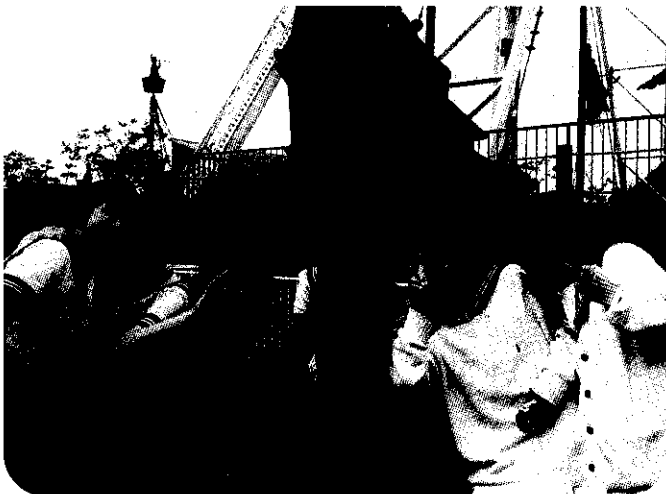
中学2年生 横浜八景島