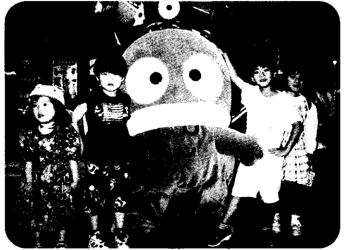
保育所 サンリオピューロランド