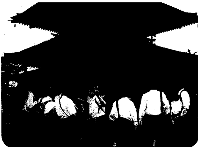
中学3年生 修学旅行(京都・奈良方面)