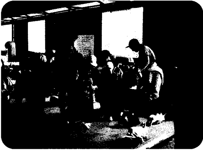
小学1年生 まかいの牧場