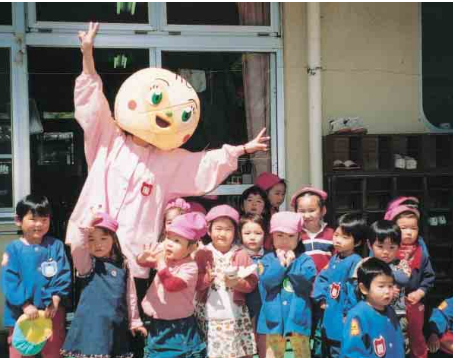
保育所 ハイポーズ