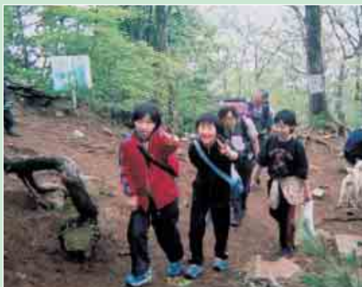
第 29 回 三ッ峠歩け歩け運動