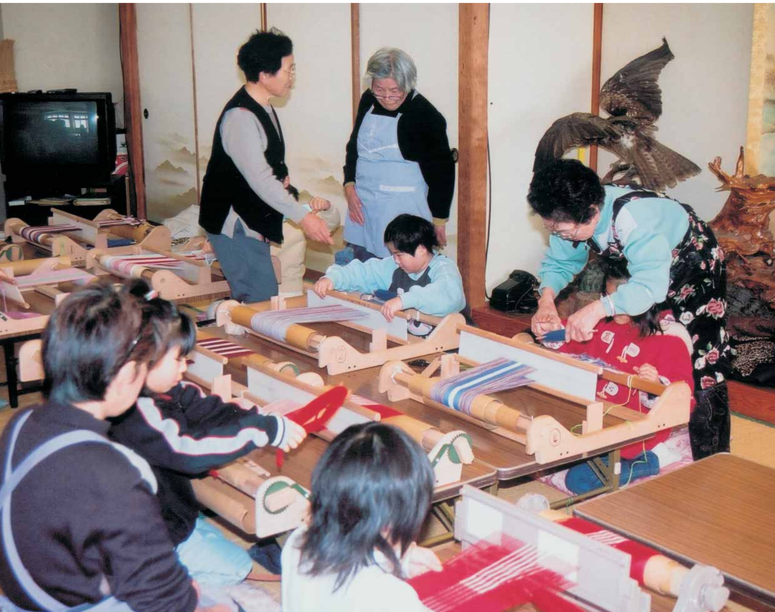
手織マフラーづくり (体験活動教室)