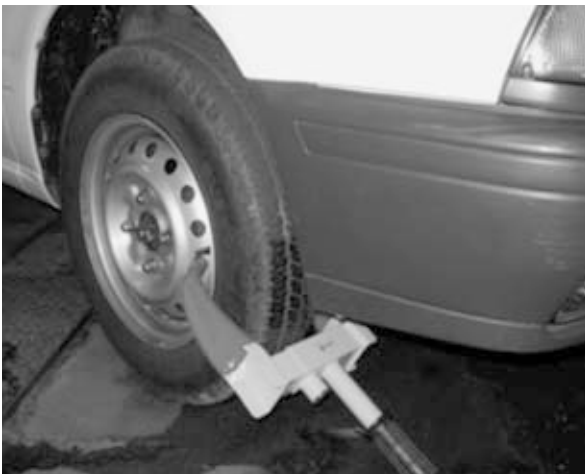
自動車の差押え例 (タイヤロックによる運行禁止措置)