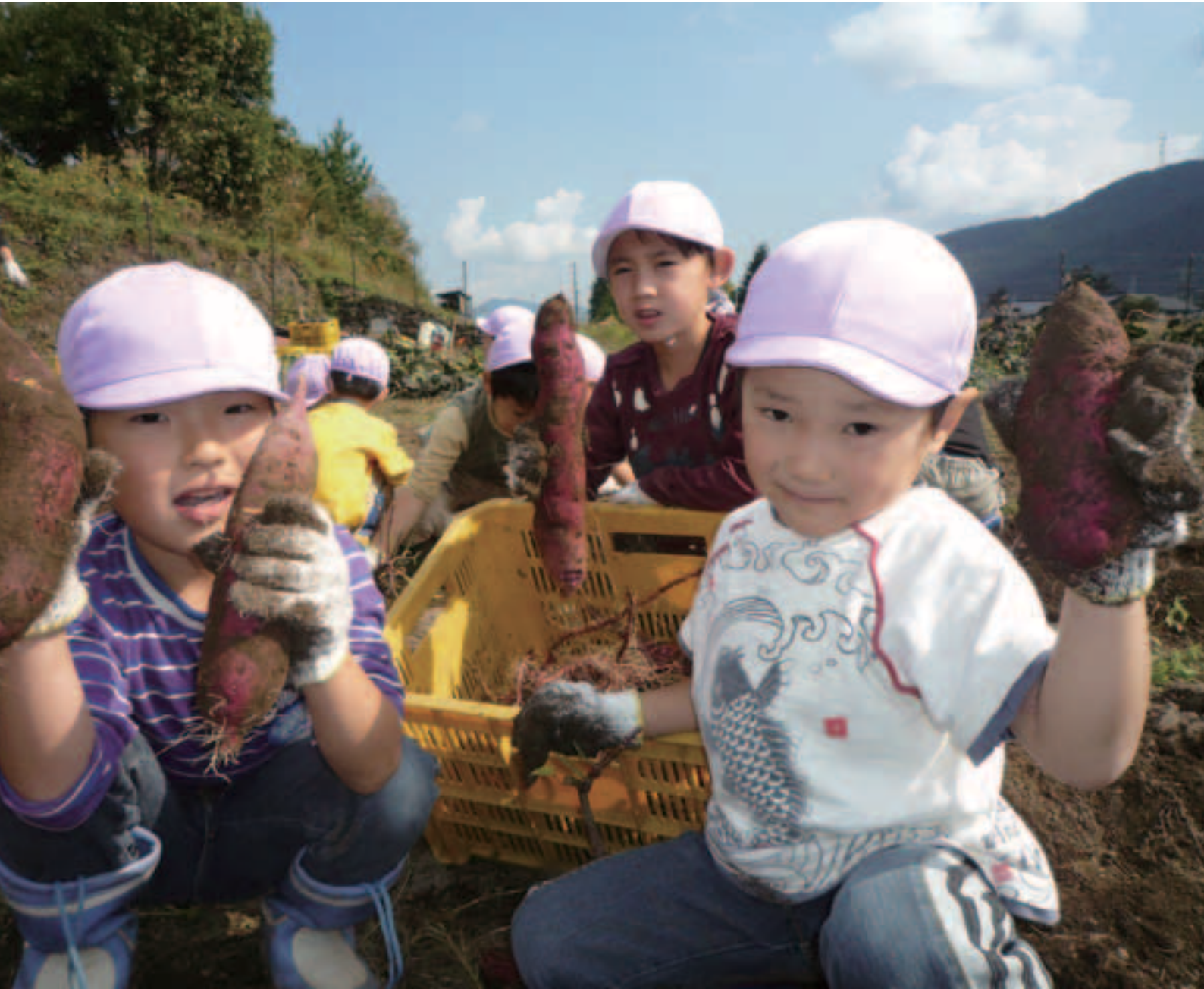
教育ファーム、さつまいも堀