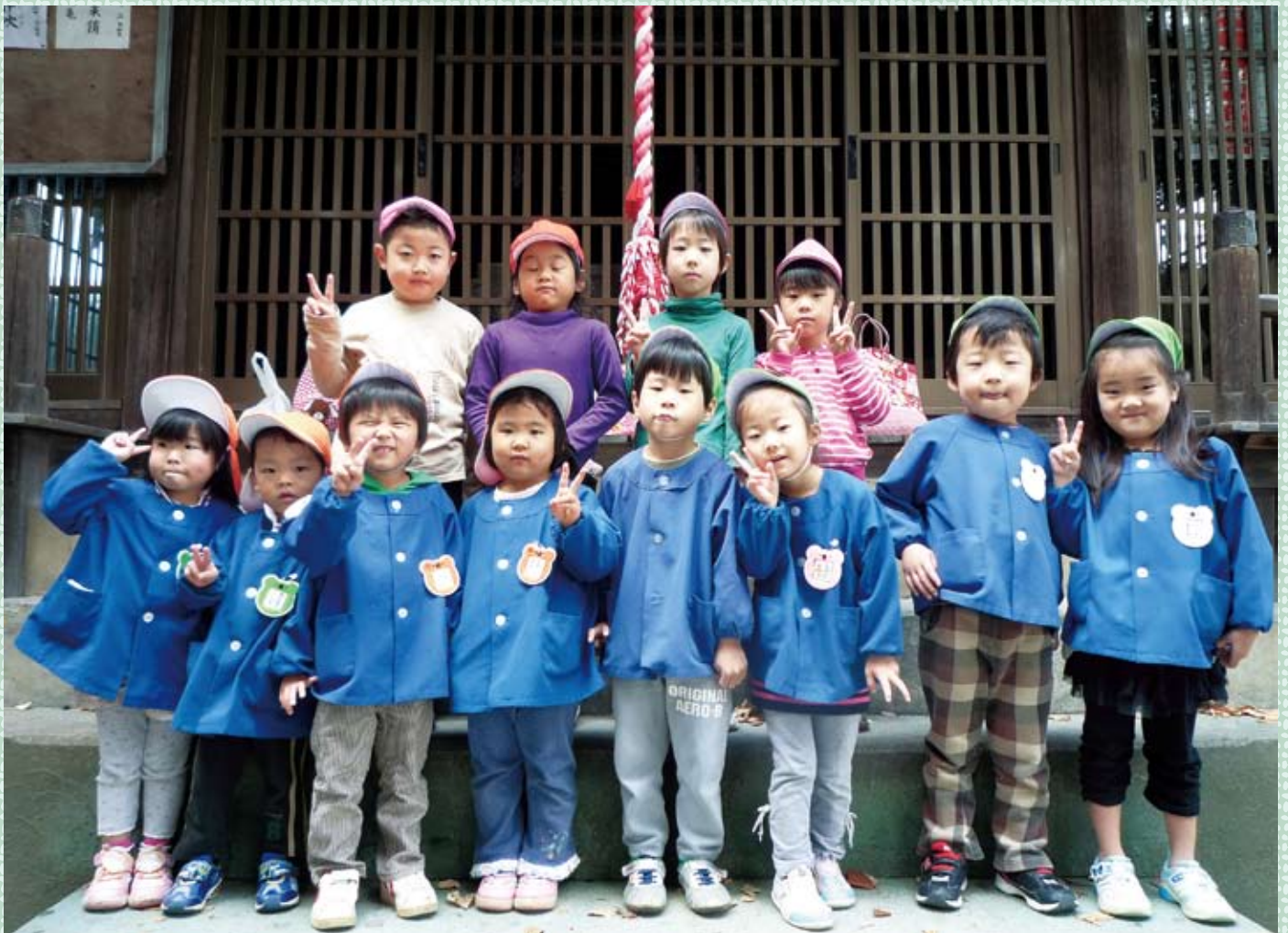
Photo : 七五三宮詣り