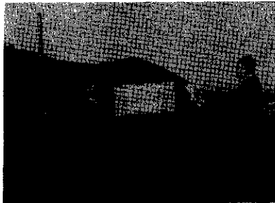
(引 渡 式)

今、西桂町の農用地の大部分は、機械化による生産性向上のための農道水路の整備を切望して居る現状と思えます。町に於いても、倉見農道を完成目前にして引続いて小沼下原農道の新設改良を計画して居りますが、これに係る国県の公共投資が大小にか、はらずすべて今後農用地指定地域に限られます。この法律による農用地利用計画は概算十年を目標として定められることになって居ります。状況変化に即した中途に於ける計画変更を行うことは出来ません。拘束の反面には税法上種々優遇措置がとられて居ります。今、町に於いてもこれに伴う一応の構想を作成して居りますのでお知らせします。