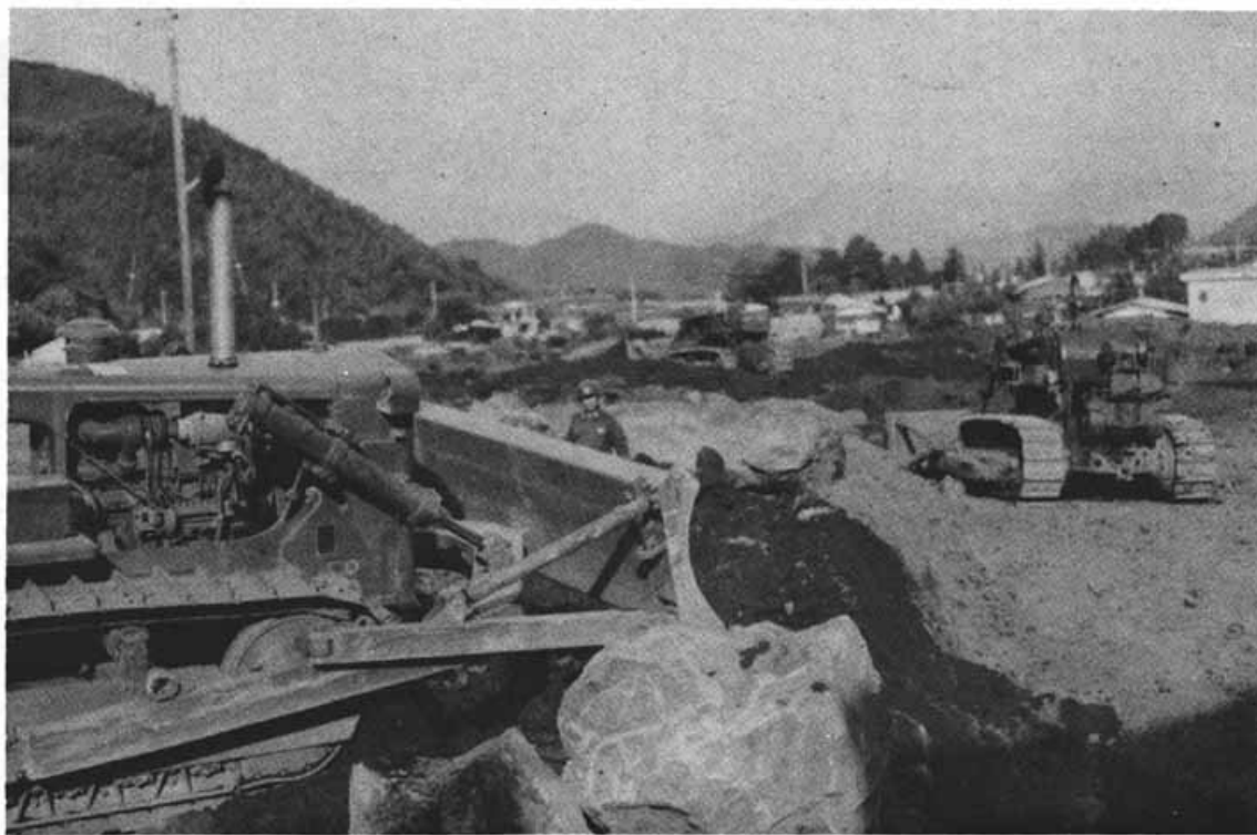
[自衛隊による造成工事]

発 行 所 西 桂 町 役 場 TEL.(05555)2121代 印刷所 えとり印刷