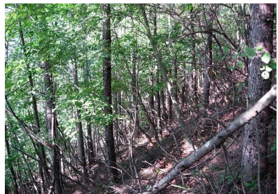
(調査対象森林イメージ)