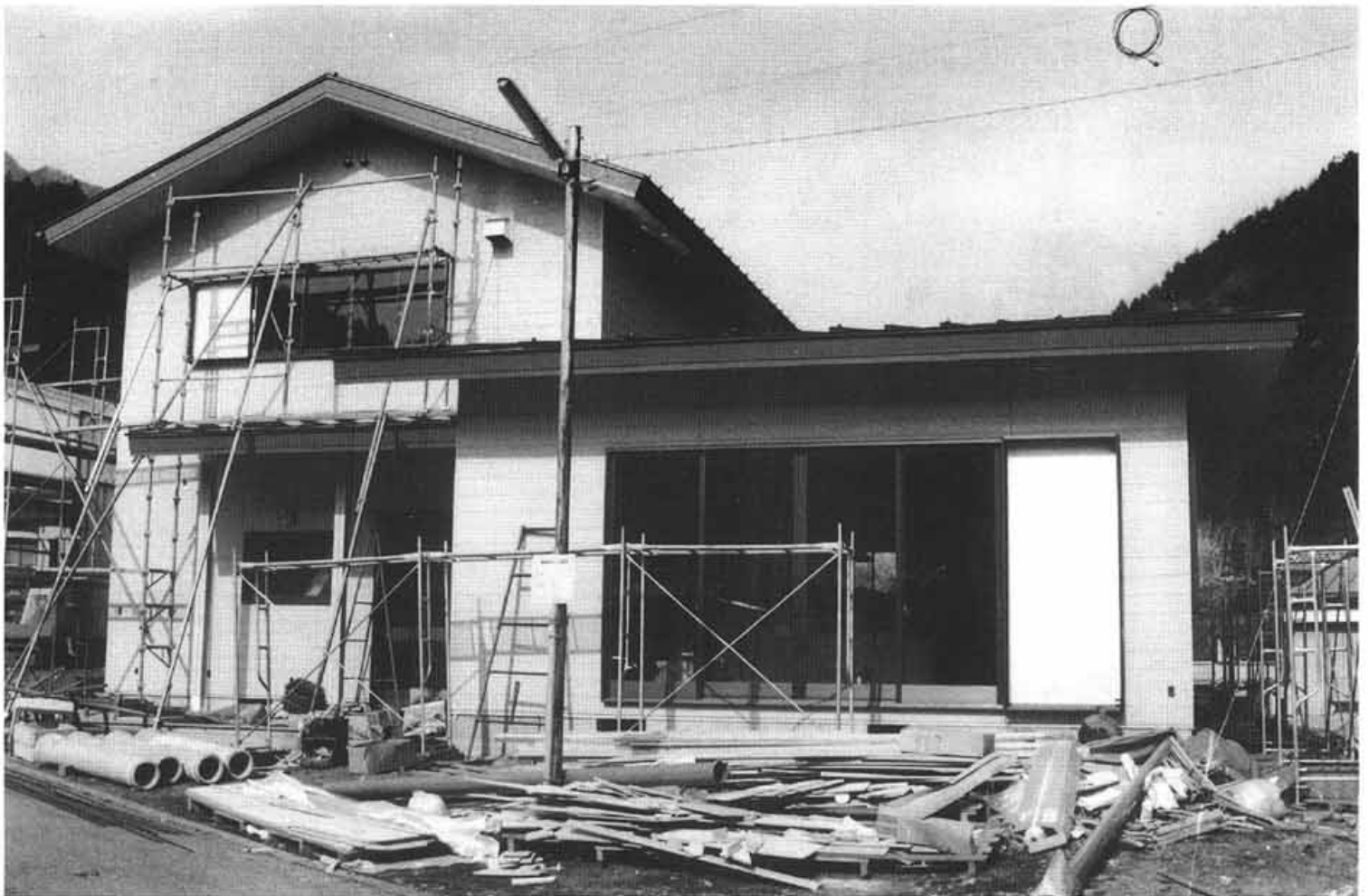
(建設中の下暮地公民館)