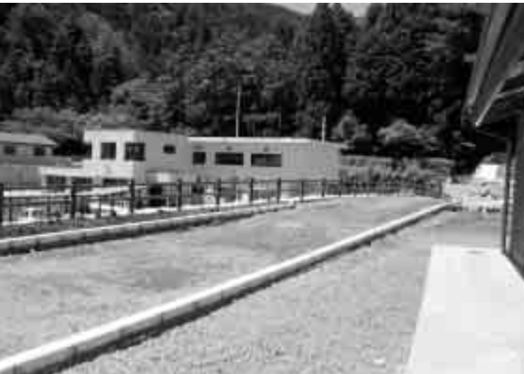
急ピッチで進むグリーンセンター周回路工事