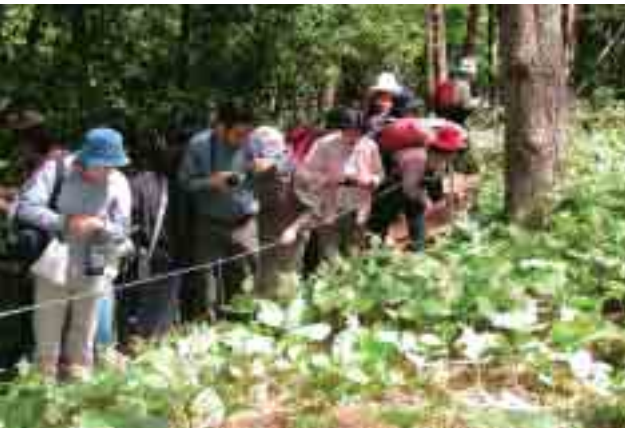
多くの訪問者が訪れたクマガイソウ祭り