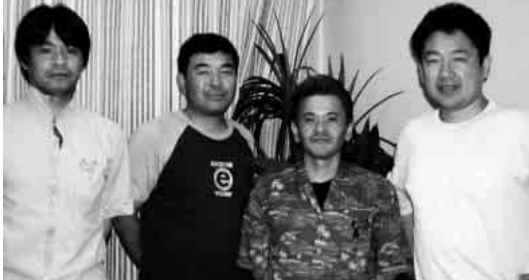
ふるさと夏祭り実行委員会幹部の皆さん