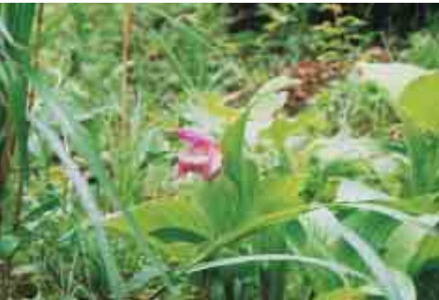
5年の歳月をかけて可憐に咲くアツモリソウ