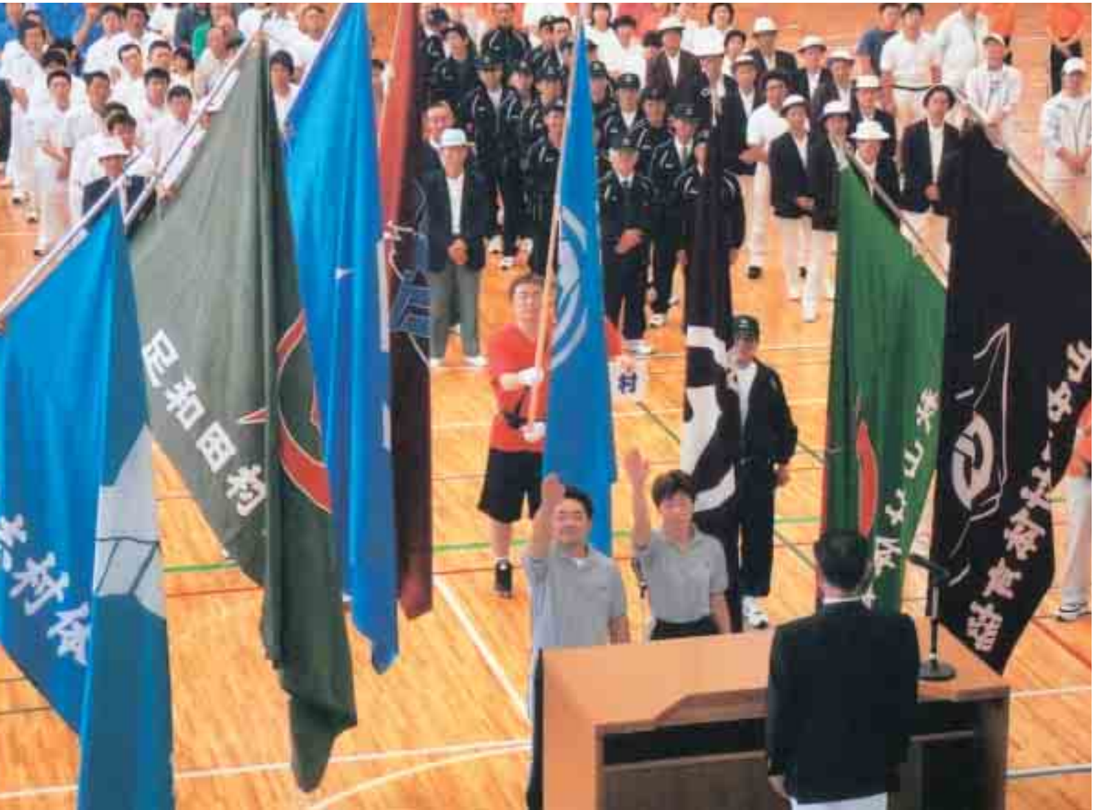
南都留郡体育祭で選手宣誓する西桂町選手

インターネットで議会を傍聴して下さい。 http://www.town.nishikatsura.yamanashi.jp/gikai/default.htm