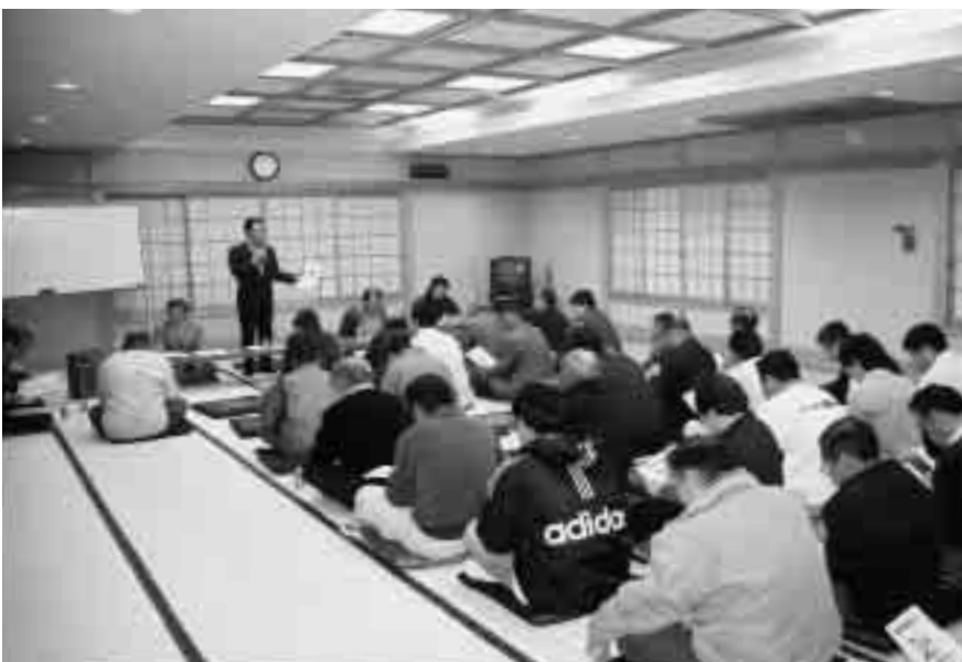
合併懇談会での活発な意見交換