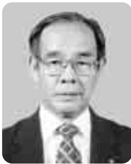
副議長 勝俣 照雄