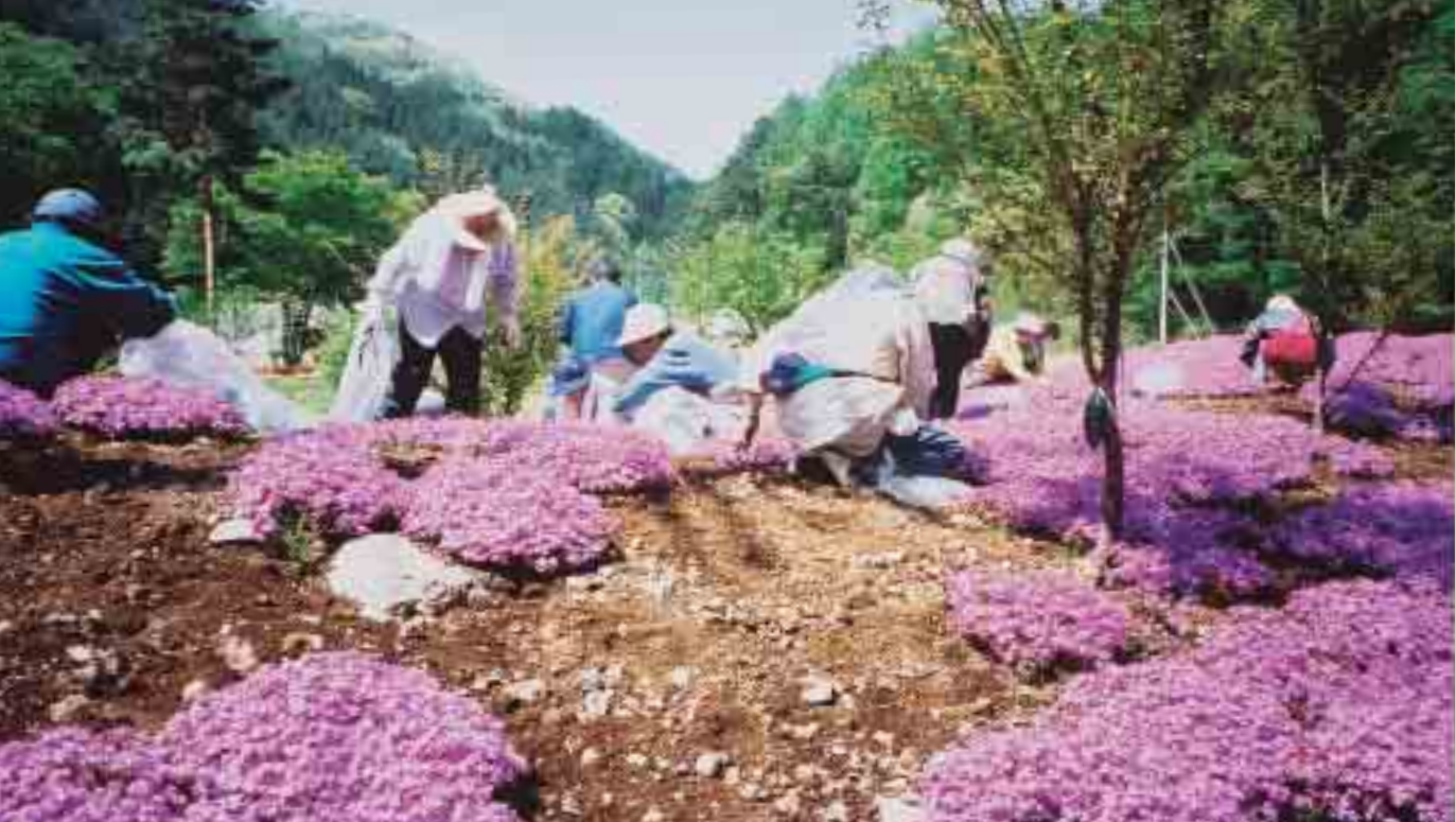
西桂町をきれいにする会の清掃活動