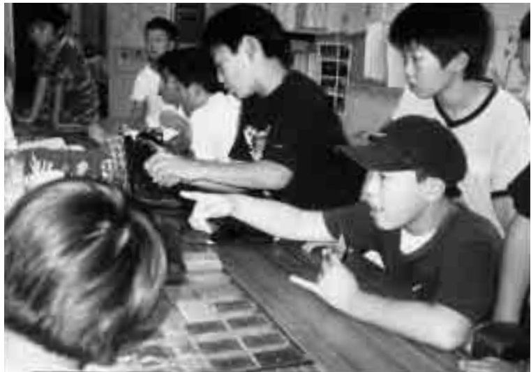
学校完全週5日制に伴い子どもたちで賑わう児童館