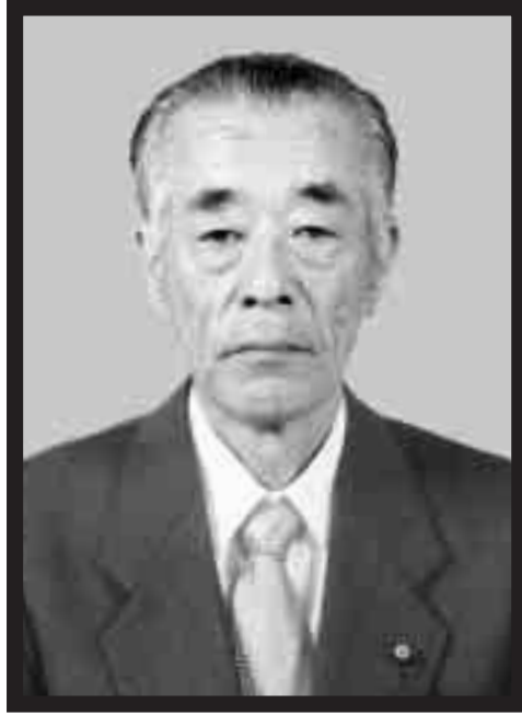
故 川村俊夫 議員