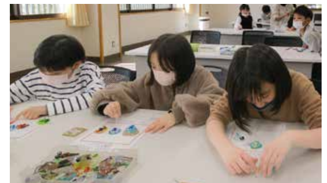
05. ガラス体験 (はしおき・マグネット)