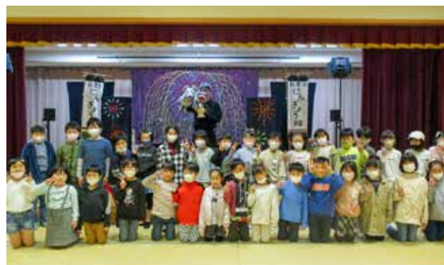
04. 人形劇鑑賞会&ミニお楽しみ会