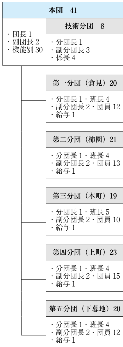
組織図(数字は定数であり、実員数ではない)

特定の活動(主に日中の火災)にのみ参加しますが、行えることは、消防団員と同じとなります。