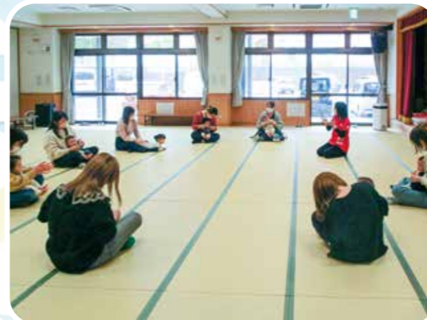
ミュージック・ケア