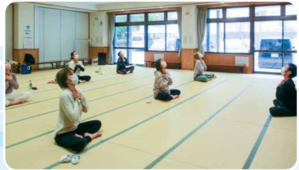
ママのためのヨガ教室