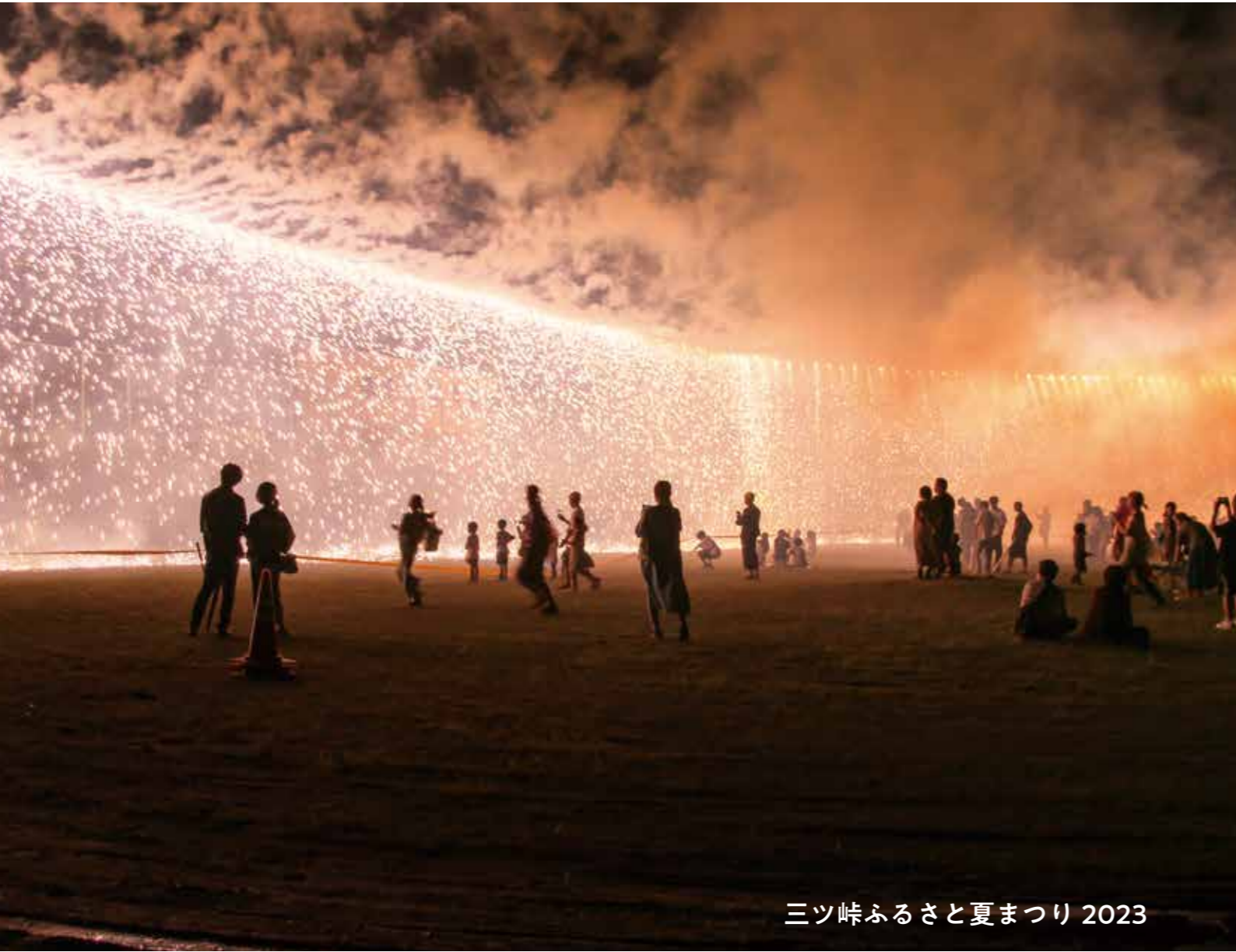
三ツ峠ふるさと夏まつり 2023