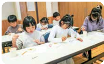
ガラス体験(絵付け)