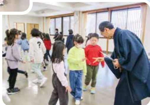
川辺先生と遊ぼう!