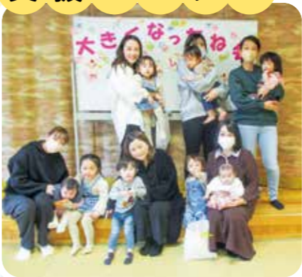
おおきくなったね会&よみきかせ会