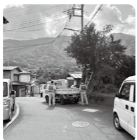
道路環境整備（枝打ち・草刈り）