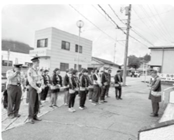
秋の全国交通安全運動啓発活動

※令和7年度も、ふるさと夏まつりなど多くのイベントが実施され、町の交通安全意識の向上のために活動しました。ここに記載された活動以外にも各地区の交通安全活動、地区イベント等へも積極的に参加しています。