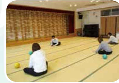
ママのための フィットネス教室