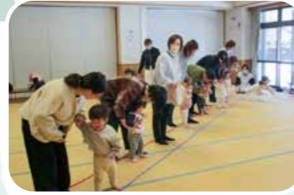
リトミックあそび