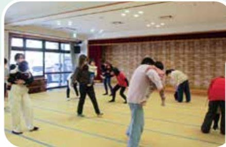
ミュージック・ケア