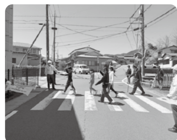
小学校6年生交通安全教室