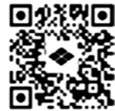
自衛隊山梨地方協力 本部ホームページ