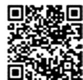
北富士駐屯地公式 アカウント（X）

問合せ 陸上自衛隊北富士駐屯地広報室 ☎ 0555-84-3135（内線 250）