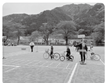
小学校3年生自転車教室