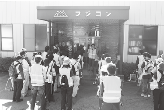
フジコン(株) 下暮地内・三つ峠駅周辺の清掃事業