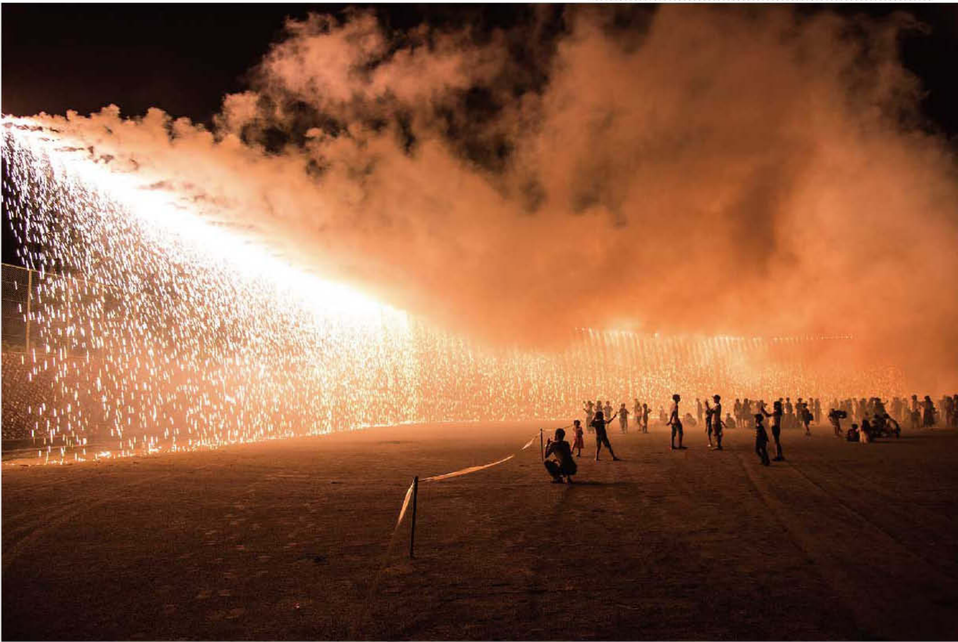
□8月15日に行われた三ツ峠ふるさと夏祭りのナイアガラ花火

西桂町に来て2年半が経とうとしています。地域のカメラマンとして町内の風景を撮り続けているわけですから、任期の3年が終わる際には西桂町の魅力を濃縮した写真展を開き、同時に写真集を作りたいという目標を常に持ちながら活動してきました。そしてその目標を達成すべく色々な展示場所を探していましたが、ようやく発表できる場所と展示期間が決定しました。