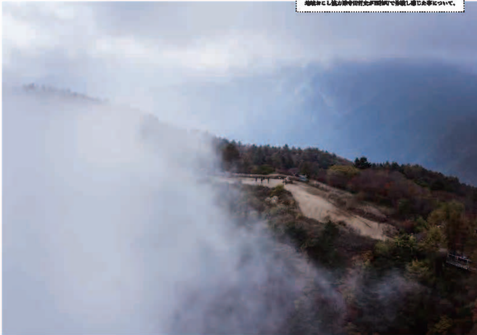
□三ツ峠山頂から下を見下ろすと霧に包まれた幻想的な空間があった。

富士山に雪が積もり、秋の終わりと冬の訪れを感じています。西桂町も紅葉シーズンで三ツ峠山道に登山客の姿を多く見るようになりました。澄んだ空気のなか登山道を歩く爽快さは肌で感じるものなので写真にはなかなか写りませんが、SNSで発信を続けていき多くのの人に秋の三ツ峠の素晴らしさを体験してもらいたいです。