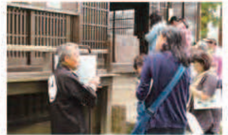
富士山巡礼の街道だった富士みちを歩き、町内各地を巡り、豊かな自然や西桂町の文化・歴史を紹介しました。