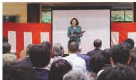
西桂町の歴史や伝統文化などが紹介されました。