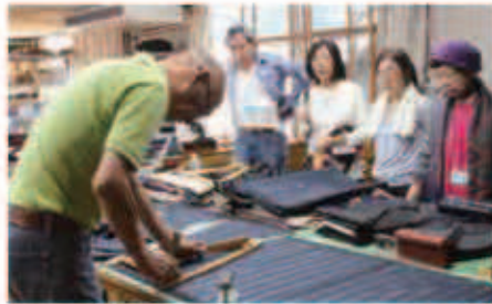
古くからの伝統産業である織物を紹介しました。

西桂町には豊かな自然とともに生きてこられた暮らしの名人・達人と呼ばれるような食やものづくりの技術、文化、地域へ誇りを持った方がたくさんいます。その力を掘り起こし、地域の表舞台に再び登場していただき、子どもたちや若者世代に継いでいくことができる町となるための、地域づくりに必要な示唆と刺激を与えてくれるサミットとなりました。