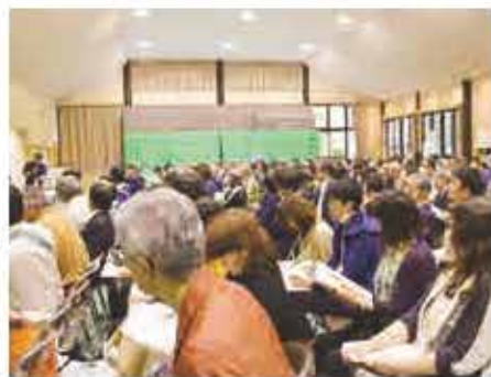
会場には、全国から250名もの方々が訪れました。