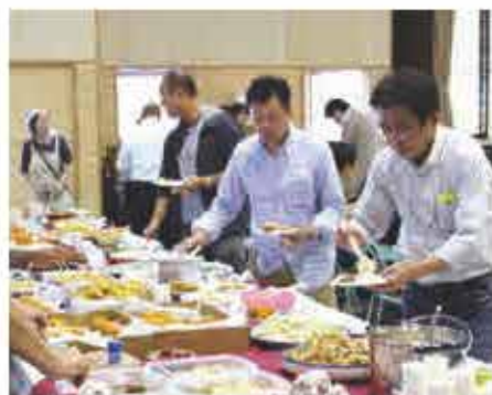
我が家のおかずやおやつ、おはちやんたちの得意料理が持ち寄られました。

また、このサミットを成功させるために、ワーカーズユープを中心に、町の各種団体や個人等が実行委員会を立ち上げ、本年2月から9回にわたり、議論をしてきました。当日は、伝統産業や地元の食生活の紹介、町内各地・三ツ峠の案内や説明など多くの皆様協力し、県内外から訪れた参加者をもてなしました。