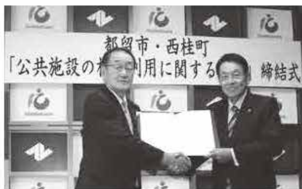
都留市役所で行われた締結式