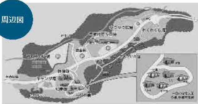
都留市施設相互利用対象施設一覧表